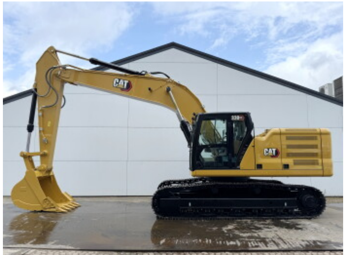
Plate % 100 Sprocket% 100 Cadena% 100 Ancho de la placa 60 cm