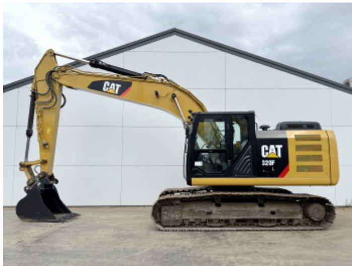
Plate % 85 Sprocket% 85 Cadena% 85 Ancho de la placa 80 cm