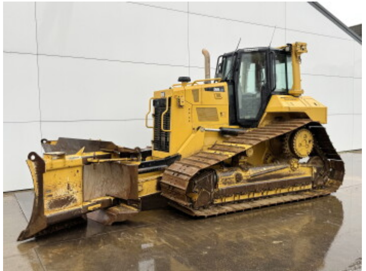
Plate % 30 Sprocket% 80